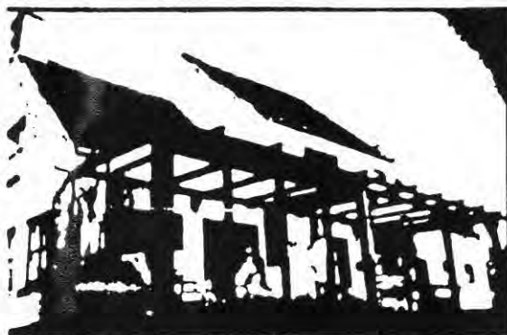
Een extra leefruimte in uw huis

VERANDA'S • PERGOLA'S • ZWEMBADOVERDEKKINGEN