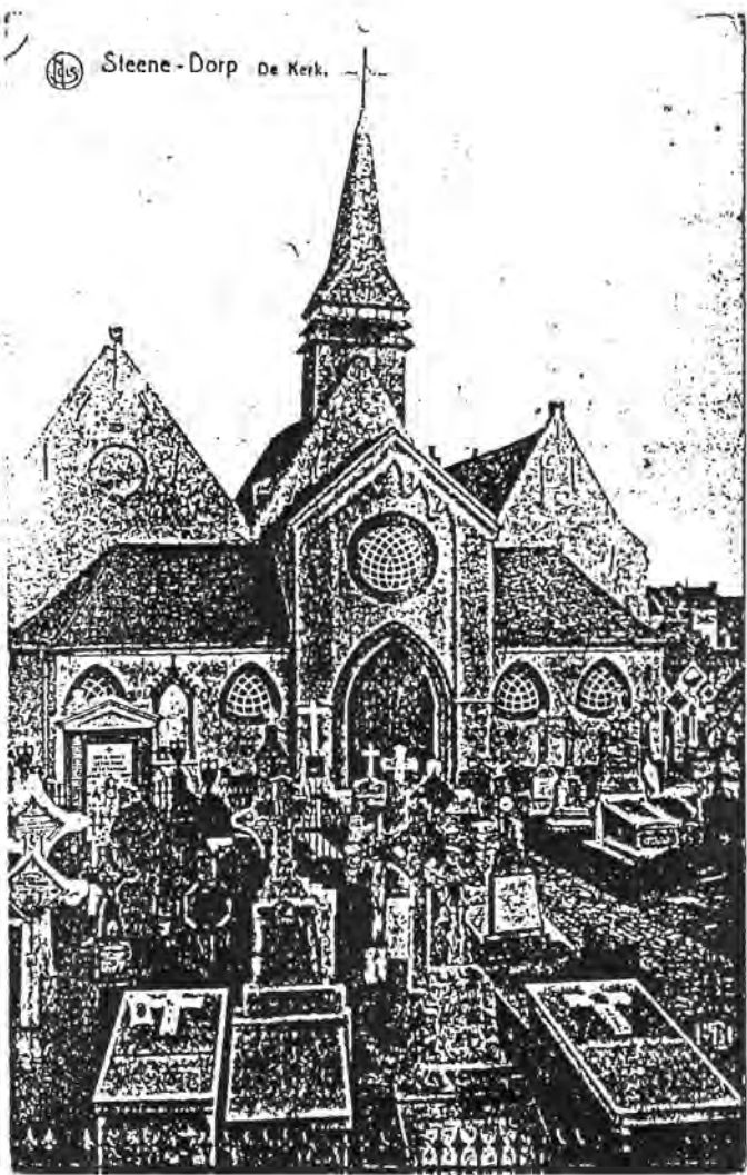
145 Steene-Dorp De Kerk.