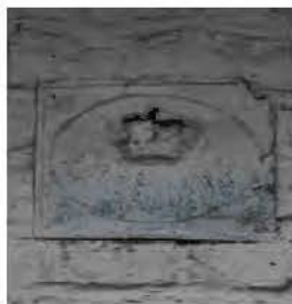
Het brandplaatje aan het Boldershof