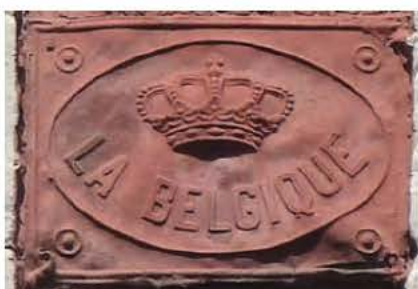
Een origineel exemplaar