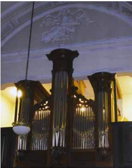
Het nieuwe orgel.