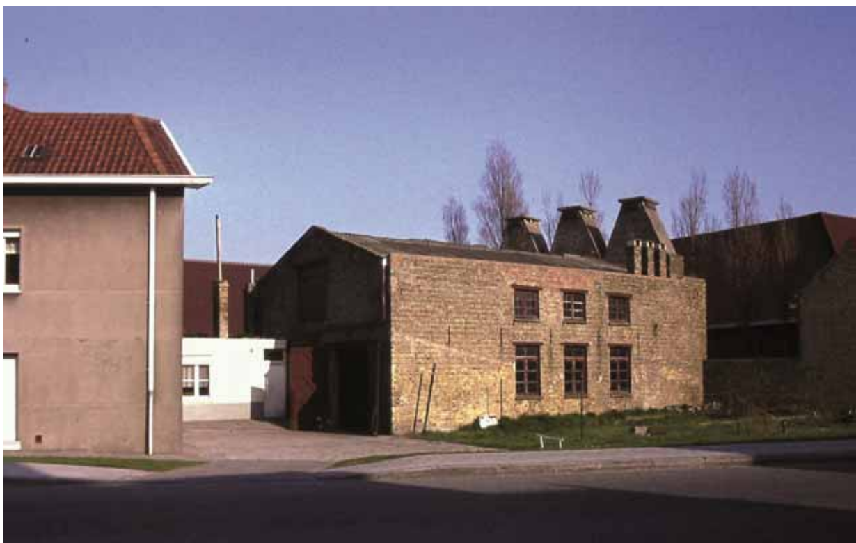
De "Haringrookerij De Meiboom". Uiterst Rechts een gedeelte van de A. Van Glabbekeschool. De rokerij werd in 1977 afgebroken en in de plaats kwam er de residentie Kennedy II, Manitobalaan.