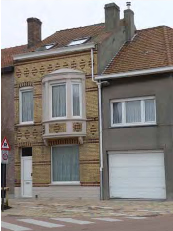
De woning van het echtpaar gelegen in de August Vermeulenstraat, vroeger de Frère Orbanstraat.