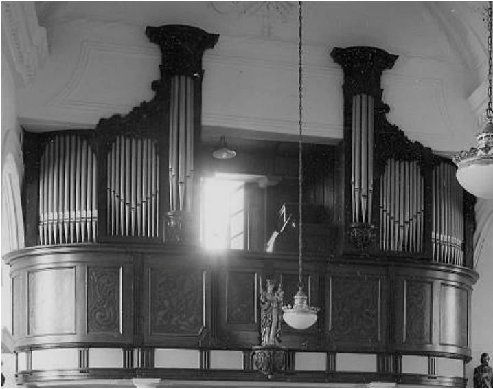
Het orgel na de transformatie van 1935, gefotografeerd in 1968 door J.P. Renard. © KIK-IRPA, Brussel (België)