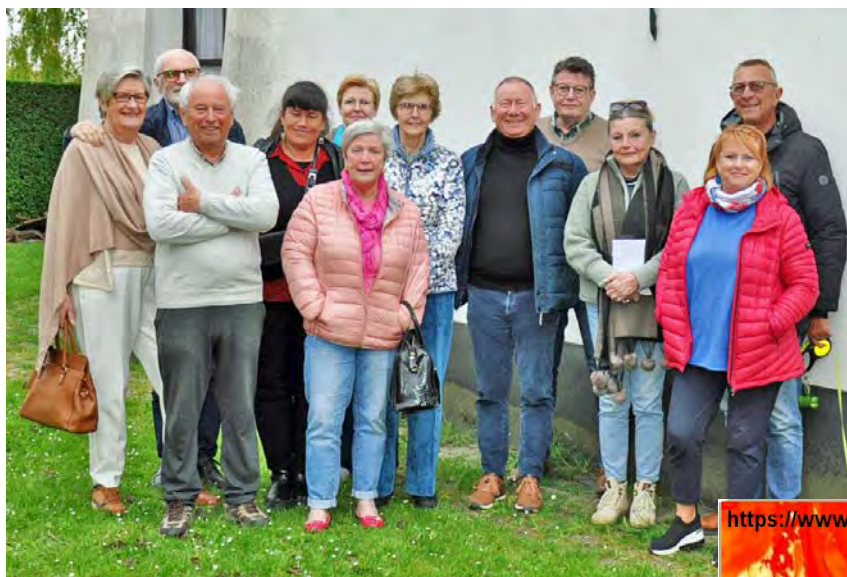
Op 18 april 2024 kwamen de kunstenaars samen in de molen.