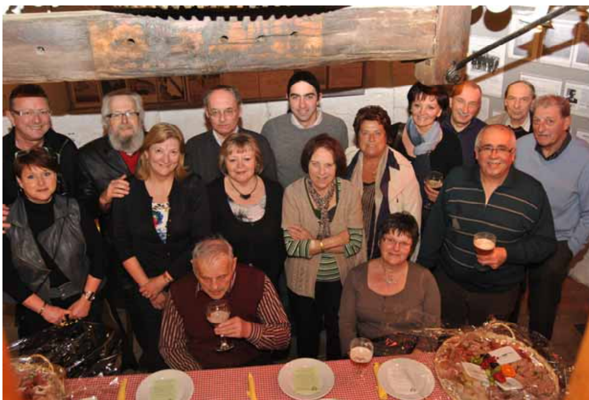
Enkele van de deelnemers aan de Breughelavond maart 2013