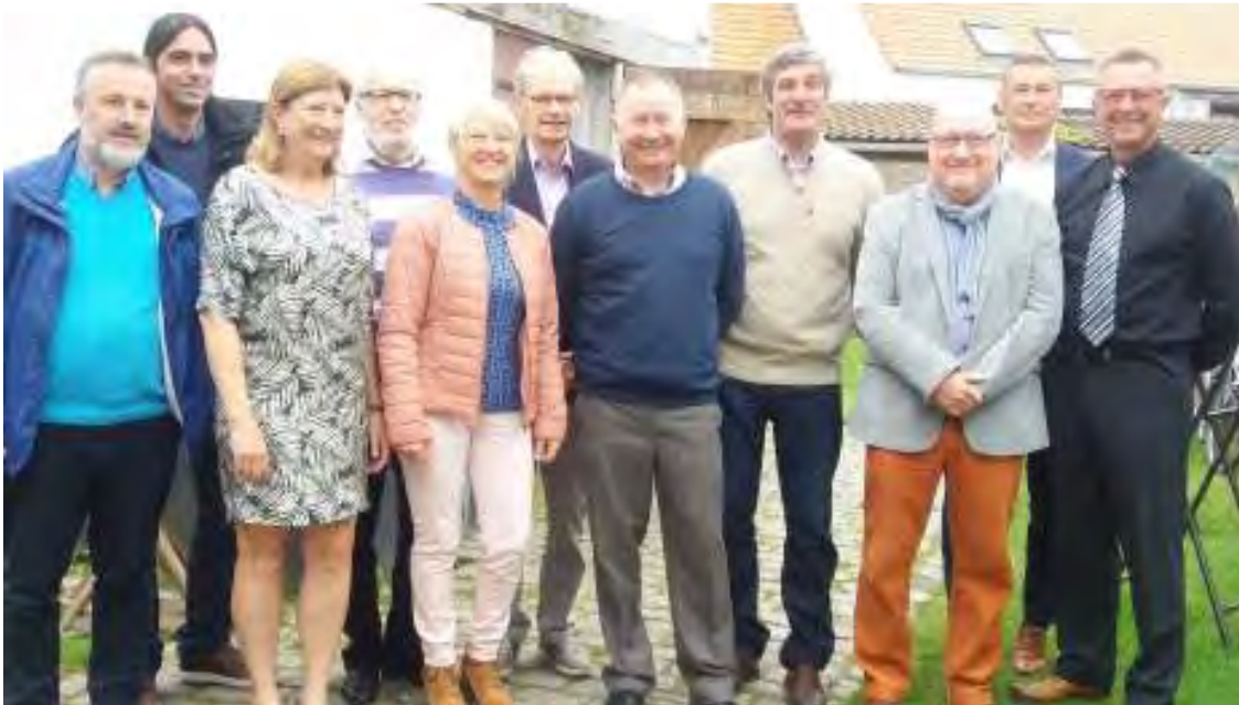
De gastsprekers samen met het bestuur.

De Zevende dag op zondag 7 mei 2017. Zoveel 7's kan niet anders dan onder een goed gesternte verlopen. En zo gebeurde het ook. Drie interessante en vlotte sprekers. Veel volk. Gezellig knus binnen en buiten.