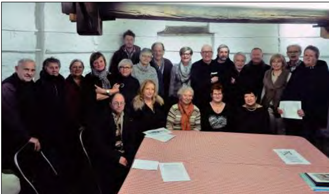
Samenkomst van de kunstenaars die in de molen zullen tentoonstellen tijdens de zomermaanden 2017